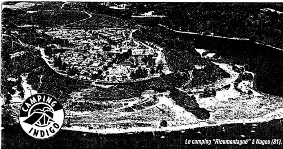
Le camping "Rieumontagné" à Nages (81).