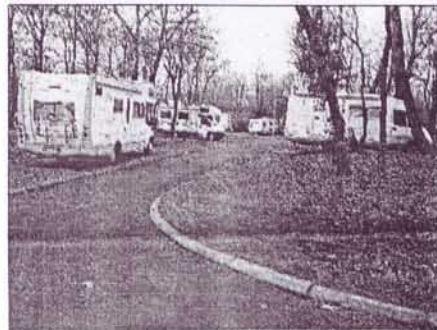
Un partenariat avec l'office national des forêts assure un label de camping respectueux de l'environnement. Lyon va bientôt en bénéficier

> NOTE Camping international de Lyon, Porte de Lyon à Dardilly, 04 78 35 64 55 et www.camping-lyon.com