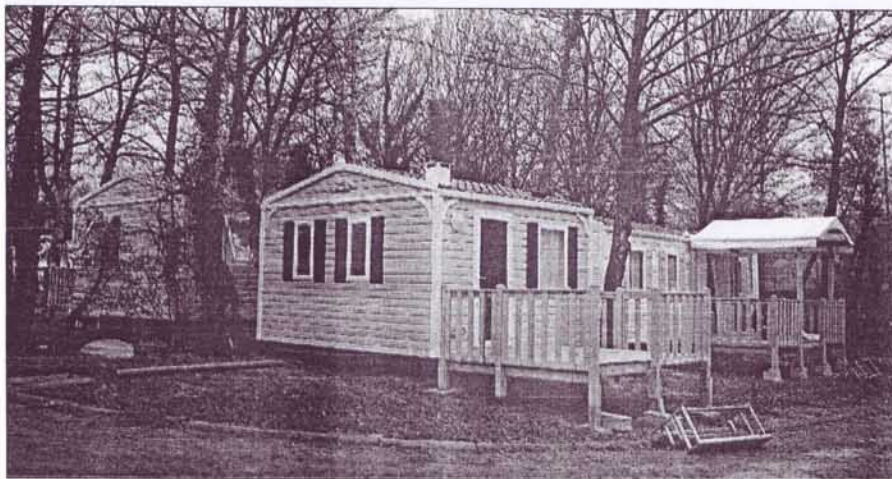
L'hébergement locatif, c'est-à-dire les mobile homes, est appelé à se développer

Hors saison, et parce que le camping est ouvert toute l'année, c'est aussi une clientèle de professionnels qu'il convient d'accueillir en séjour temporaire, artisans travaillant sur des chantiers lyonnais, salariés en formation... appréciant, aussi, le plein air. Pour soigner ce cadre naturel de 7 hectares, Huttopia a signé un partenariat national avec l'Office national des forêts afin de travailler à Lyon, comme sur les autres campings exploités, au traite-